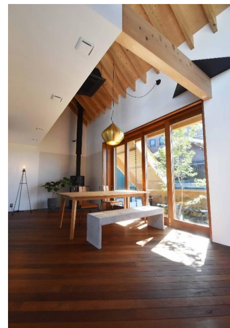
尚建工務店モデルハウス

【備考】 上水道加入者納付金37,400円、 下水道受益者負担金300,000円が別途必要